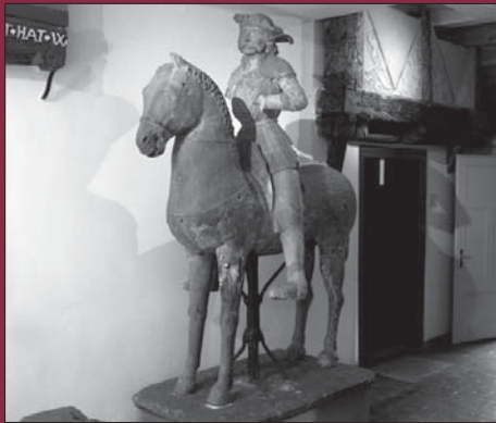
Reitender Roland von 1528