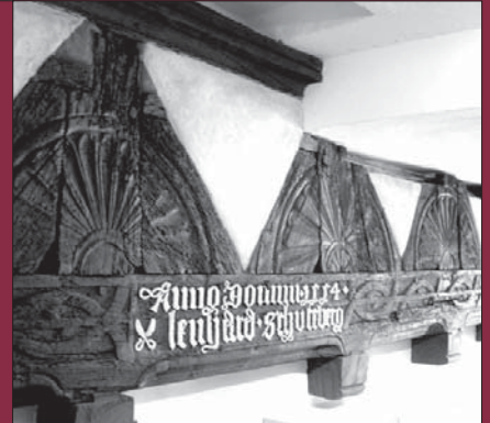
Fachwerk von 1554