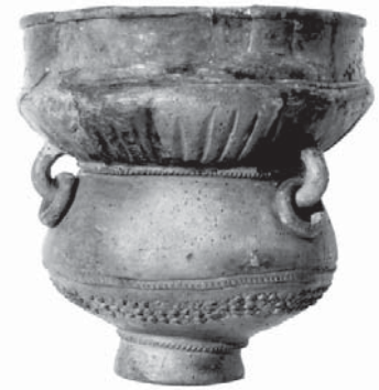
Doppelgefäß aus Emden Römische Kaiserzeit