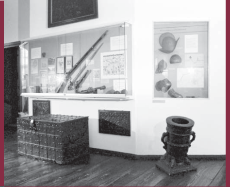
Wehrhaftes aus der Stadtgeschichte