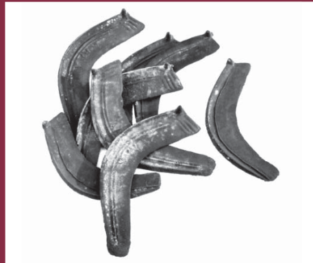
Bronzezeitliche Knopfsicheln Hortfund aus einem Hünengrab

Die materiellen Hinterlassenschaften vergangener Kulturen stehen als vorrangige Informationsquelle zur Ur- und Frühgeschichte der Region Haldensleben im Vordergrund der diesbezüglichen Museumsausstellung. Neben der Material- und Formenvielfalt der Exponate bietet die chronologisch gegliederte Ausstellung Wissenswertes zu den regionalen Besonderheiten der einzelnen Zeitabschnitte.