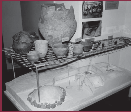
Funde und Befunde Hügelgräber bei Hundisburg