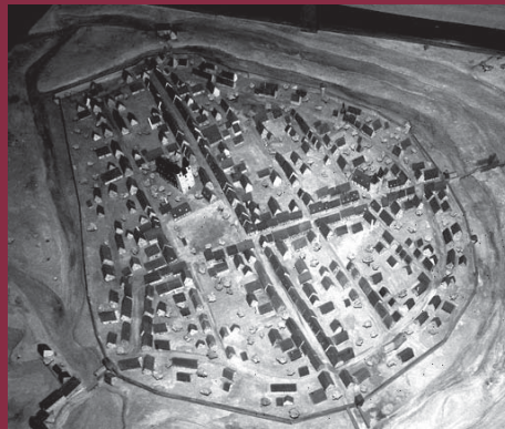
Neuhaldensleben 1683 Stadtmodell

Die Geschichte Haldenslebens ist seit dem 10. Jahrhundert durch urkundliche Erwähnungen und chronikalische Berichte mehr oder weniger gut bekannt.