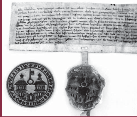
Stadtsiegel und Urkunde 14. Jahrhundert